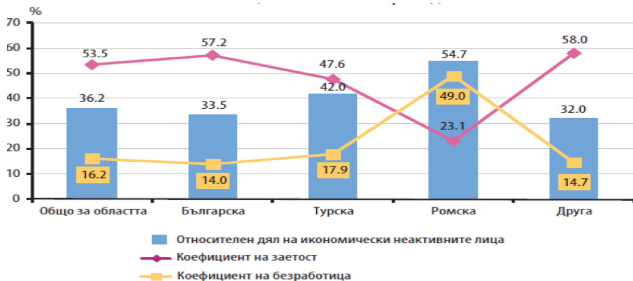
Фиг. 3. Коефициент на заетост и безработица и относителен дял на икономически неактивните лица по етническа принадлежност

Коефициентът на безработица (данни от 2011г.) е най-висок сред лицата от ромската етническа група - 49.0%. При ромите е регистриран и най-високият относителен дял на икономически неактивно население – 54.7%. Отделните региони в Хасковска област не са еднородни по отношение на икономическата активност, поради което равнището на безработица по общини е силно диференцирано.